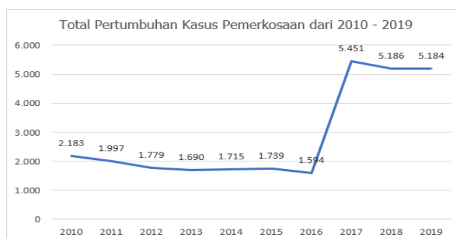
Grafik 1. Kasus Pemerksaan di Indonesia Periode 2010 - 2019