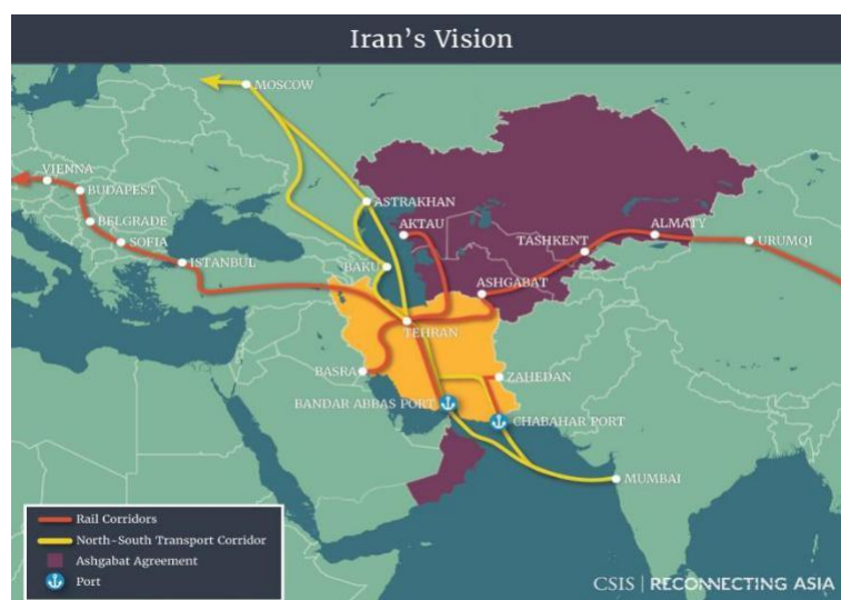
Gambar 2. Posisi Strategis Iran dalam jalur kereta Silk Road

barang produksi, Impor-ekspor tanpa hambatan, meningkatkan jumlah wisatawan Tiongkok di Iran begitu sebaliknya. Pemerintah Iran memanfaatkan peluang kerjasama ekonomi dengan Tiongkok yang mengambil kebijakan prioritas pada peningkatan Infrastruktur transportasi termasuk Kereta api. Hal tersebut bertujuan untuk memperkuat Konektivitas Internasional antara kota-kota besar di Iran serta memelihara hubungan baik dengan negara-negara tetangga. Mendorong perusahaan dalam negeri Iran lebih aktif dalam mencari kemitraan dengan perusahaan luar negeri lain selain Tiongkok agar mereka memperoleh keterampilan, Transfer teknologi serta sumber daya yang akan diperlukan guna melaksanakan proyek. Sedangkan Tantangan yang hadapi Iran adalah banyaknya proyek infrastruktur transportasi yang sedang proses, maka banyak pula perusahaan lokal yang tidak memiliki kemampuan teknologi untuk menangani dengan biaya yang efektif.