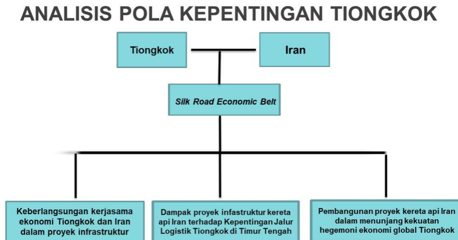
Bagan 1 Analisis Pola Kepentingan Tiongkok

pembangunan Infrastruktur kereta api melalui Teori dan Konsep yang sebelumnya telah dijelaskan.