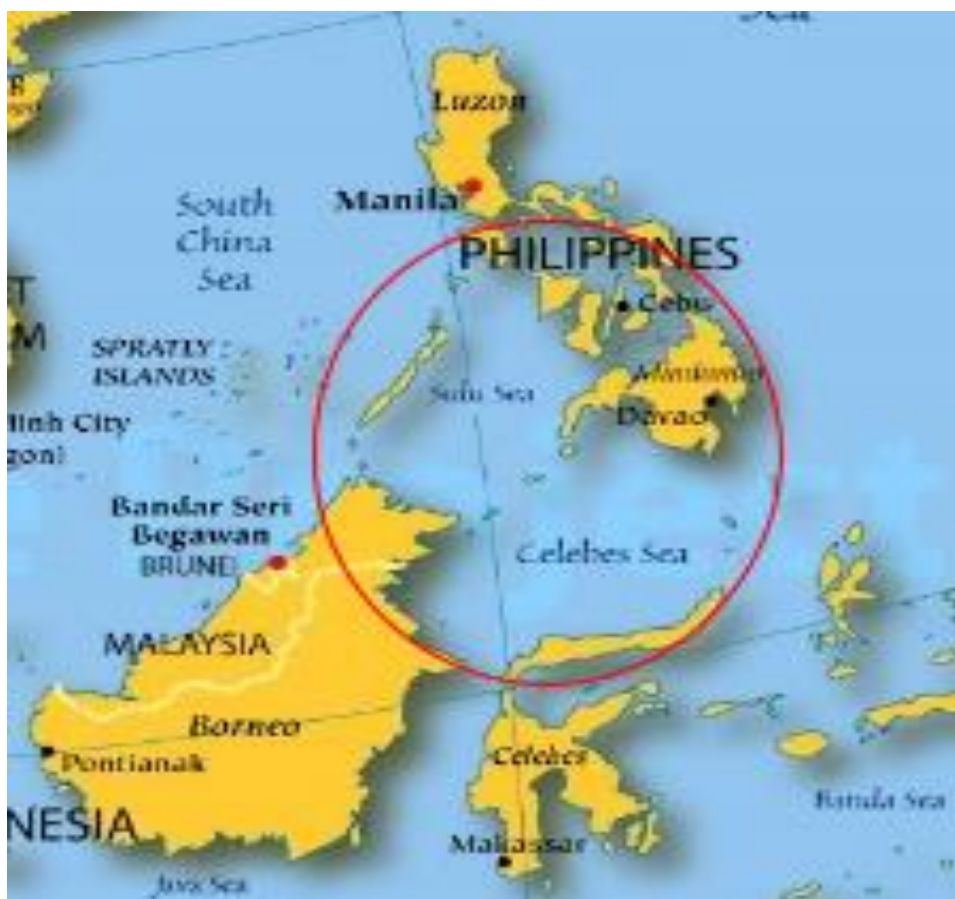
Gambar 1. Letak Geografis Laut Sulu

perdagangan, dan aktivitas perekonomian masyarakatnya seperti profesi nelayan. Salah satu kawasan Laut di Asia Tenggara yang aktivitasnya cukup padat adalah Laut Sulu. Laut ini terletak di bagian timur dari Palawan, Filipina serta Sabah, Malaysia dan berada di bagian barat dari Visayas dan Mindanao, Filipina (Underwater Asia, 2019).